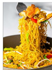
NOEDEL MET KIP EN WOKGROENTEN

Er zal een mobiele keuken naar de afdeling komen en iemand van Umami zal dit gerecht op dat moment klaarmaken.